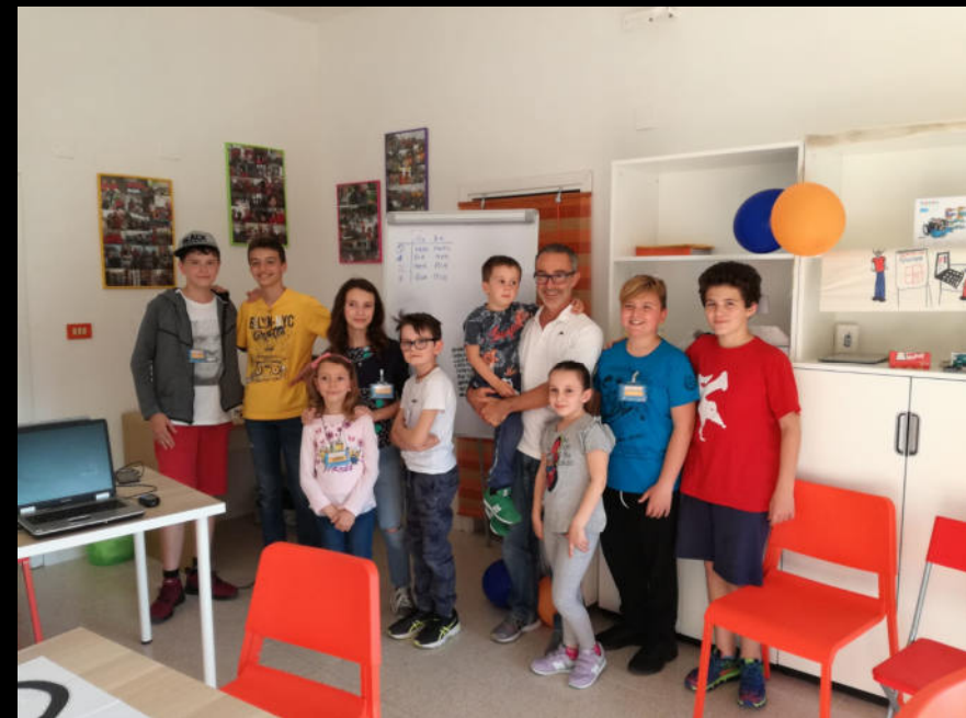
Scratch DAY Bibbona, 2018